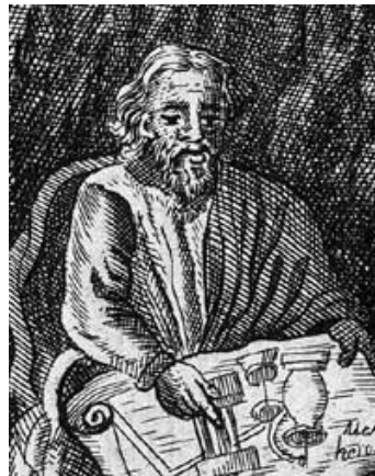
Heron von Alexandria (1. Jahrhundert n.C.)