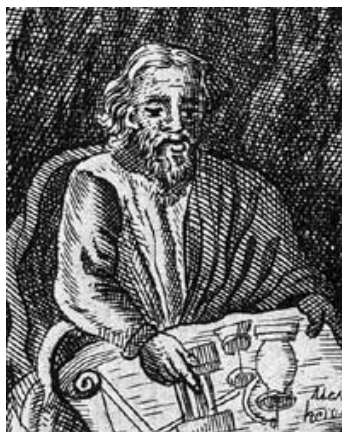
Heron von Alexandria (1. Jahrhundert n.C.)