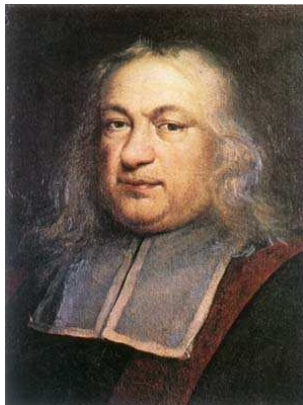
Pierre de Fermat (1607/08-1665)

dass für jede Primzahl p die Einheitengruppe des Restklassenkörpers \mathbb{Z}/(p) zyklisch ist! Diese Gruppen nennt man auch die primen Restklassengruppen .