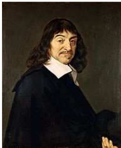
Rene Descartes (1596-1650)

folgt Y = X^2 und X = Y^2 , also auch Y = Y^4 (ebenso für X ). Dann ist Y = X = 0 oder X und Y sind beide eine dritte Einheitswurzel (und zwar sind beide 1 oder es sind die beiden anderen dritten Einheitswurzeln). An diesen anderen Verschwindungsstellen der beiden partiellen Ableitungen hat aber F den Wert -1 , diese sind also keine Punkte der Kurve.