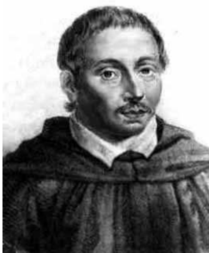
Bonaventura Cavalieri (1598-1647)

Für Berechnungen ist das Cavalieri-Prinzip entscheidend. Mit ihm wird die Berechnung eines n -dimensionalen Volumens auf die Integration des (n - 1) -dimensionalen Volumens des Querschnitts des Körpers T zurückgeführt. Zu einer Teilmenge T \subseteq [a, b] und einem x \in [a, b] nennt man T(x) = (\{x\} \times \mathbb{R}^{n-1}) \cap T den Querschnitt von T durch x . Der Querschnitt ist eine kompakte Teilmenge des \mathbb{R}^{n-1} und besitzt somit ein (n - 1) -dimensionale Volumen, das mit x variiert.