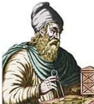
Archimedes (ca. 287 -212 v. C.)

Die ersten beiden Eigenschaften drücken aus, dass auf \mathbb{R} eine totale (oder lineare ) Ordnung vorliegt; die in (2) beschriebene Eigenschaft heißt Transitivität. Die fünfte Eigenschaft heißt Archimedes-Axiom .