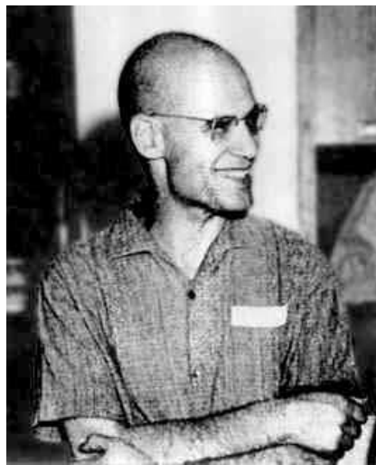
Alexander Grothendieck (1928-)

Wie hängen affin-algebraische Mengen und deren Koordinatenringe zusammen? Hier kann man nur für nicht-endliche Grundkörper gehaltvolle Antworten erwarten, da es im endlichen Fall zu wenige Punkte gibt. Eine befriedigende Theorie erfordert sogar, dass man sich auf algebraisch abgeschlossene Körper beschränkt, oder aber - das ist der Standpunkt der von Alexander Grothendieck entwickelten Schematheorie - nicht nur K -Punkte betrachtet, sondern generell maximale Ideale und Primideale als Punkte mitberücksichtigt.