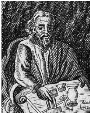
Heron von Alexandria (1. Jahrhundert n.C.)

als nächste Approximation. So fortfahrend erhält man eine immer besser werdende Approximation von \sqrt{5} .