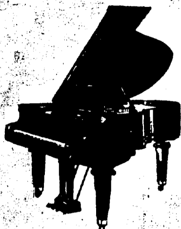
5 pieds Grand, $675 comptant. 5 pieds 7 pouces Grand, $725 comptant. 6 pieds 5 pouces Grand, $800 comptant. Conditions—$25 par mois, 6 pour cent aujour.