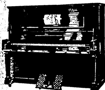
STEINWAY PIANOLA PIANOS, $1,250. Conditions—$50 par mois, 6 pour cent aujour.