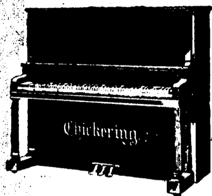
4 pieds 2 pouces droit, $500 comptant. Conditions—$12 par mois, 6 pour cent aujour.