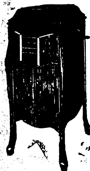
Victrola XI, 12 Records. Prix $109.