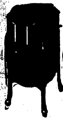
Victrola X, 10 Records. Prix $82.50.