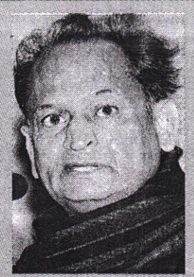
मृतक आश्रितों अनुकम्पा नियक्ति दी गई। 39524 अधिकारी-कर्मचारियों को पदोन्नत किया गया।

गहलोत ने स्वीकार कि गुर्जर आरक्षण व अन्य कारणों से भर्तियों में देरी हुई। अब खाली पदों का सर्वे करा लिया गया है। 67 हजार 700 रिक्त पदों को भरने की स्वीकृति जारी कर दी है, इसके साथ ही करीब 23 हजार और भर्तियां होंगी। एक साल में एक लाख नौकरियां दी जाएंगी। इनमें 50 हजार शिक्षकों की भर्ती शामिल है। मुख्य सचिव की अध्यक्षता में गठित समिति समयबद्ध भर्ती पर निगरानी रखेगी। उनका दावा है कि कई दिक्कतों के बावजद अब तक अनुबंध सहित 40837 बेरोजगारों को नौकरी दी जा चकी है। इनमें 18 हजार नियमित नियक्तियां है जबकि