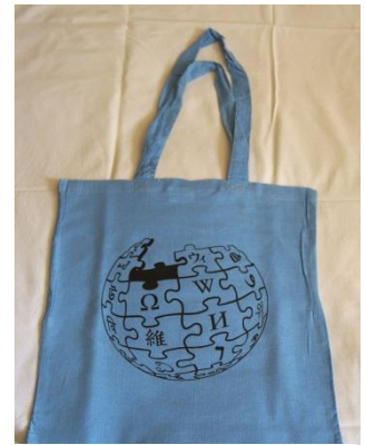
2. ábra Az egyik új wikipédiás bevásárlótáska

Folytatódott a munka a wikipédiás ajándéktárgy-készletünk felfrissítésére. Az ajándéktárgyak – köztük kitűzők, bevásárlótáskák, és jójók – március végére készültek el és eseményeinken, illetve versenyeinken díjként osztjuk el őket.