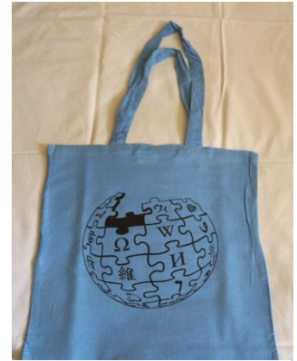
2. ábra Az egyik új wikipédiás bevásárlótáska

Folytatódott a munka a wikipédiás ajándéktárgy-készletünk felfrissítésére. Az ajándéktárgyak – köztük kitűzők, bevásárlótáskák, és jójók – március végére készültek el és eseményeinken, illetve versenyeinken díjként osztjuk el őket.