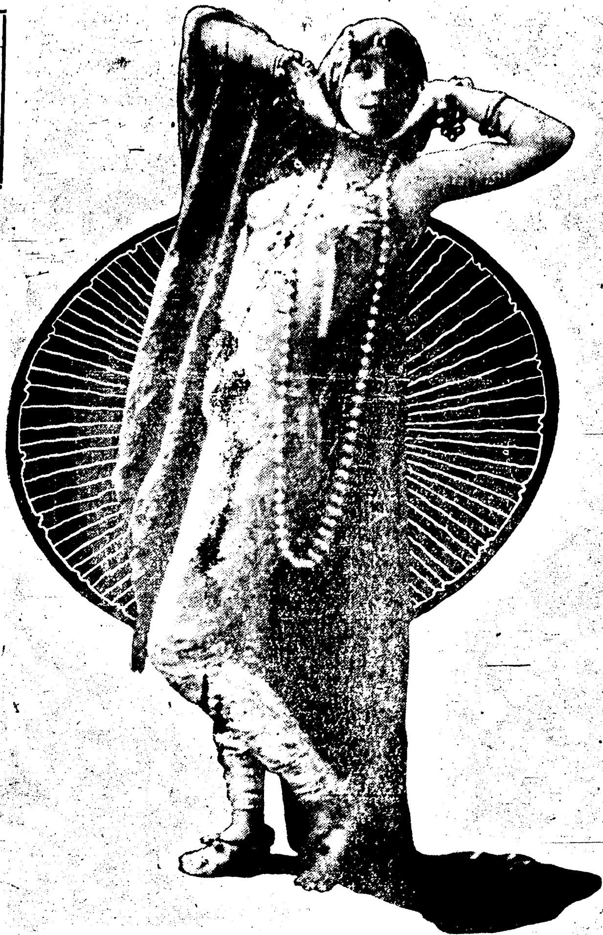
Mlle EVAN-BURROWS FONTAINE A L'ORPHEUM LA SEMAINE JANVIER 29th.