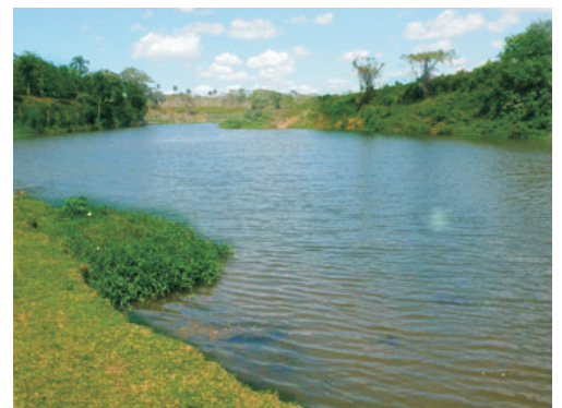
Rio Guasa, balneario turístico

Ramón Santana es una localidad pequeña ubicada al Oeste de San Pedro de Macorís, la cual cuenta con atractivos turísticos llenos de encanto y