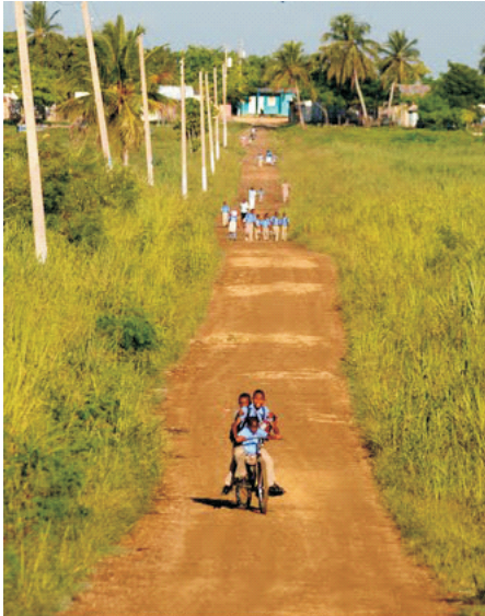
Niños del Batey caminando hacia la escuela.