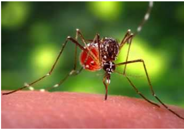
ଏଇଡିସ ଏଇଡିପ୍ଟି Aedes aegypti female mosquito