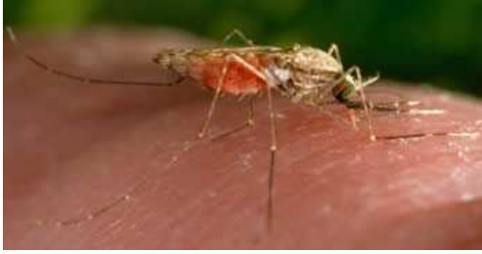
ଏନୋଫେଲିଶ ଗେମ୍ବୀ Anopheles gambiae