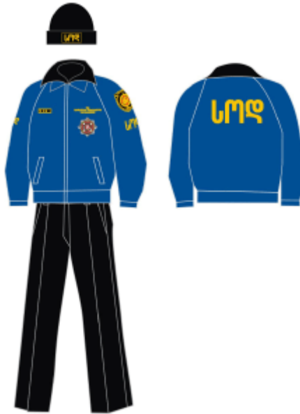
ყოველდღიური ზამთრის ფორმა