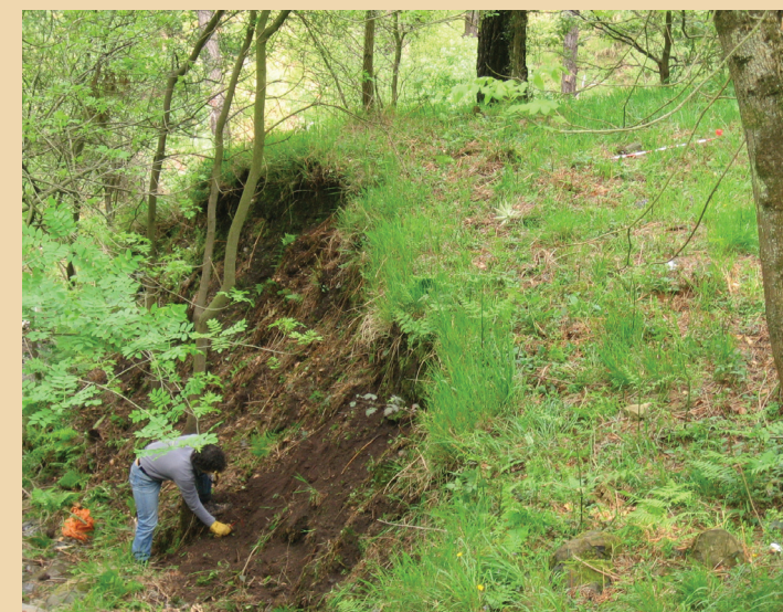
Arrastaleku (Bilbao). Vista del rellano donde se asentarían