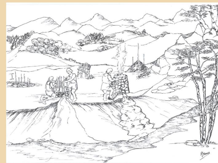
Recreación de una antigua ferrería de monte (dibujo, M.J. Franco)

Estos yacimientos arqueometalúrgicos son estudiados en la actualidad por el Equipo de Arqueología del Museo de la Minería del País Vasco. Este colectivo multidisciplinar cuenta con una geóloga, un técnico medioambiental, dos ayudantes de campo y un arqueólogo-director. Desde el año 2002 se encuentra elaborando para el Dpto. de Cultura de Gobierno Vasco la “Carta arqueológica de las ferrerías de monte de Bizkaia” a modo de inventario y catálogo de este tipo de yacimientos que culminará en el 2011 con la prospección de la totalidad del territorio vizcaíno. Los trabajos arqueológicos tratan de la búsqueda de nuevos yacimientos (al comenzar la investigación se habían localizado una treintena de estas ferrerías de monte y a día de hoy se han catalogado más de 130) y de su posterior estudio. Con ello se pretende conocer nuevos aspectos de aquel trabajo y la trascendencia de sus protagonistas, los ferrones, dado que con el estado actual de conocimiento difícilmente podremos insertar aquella actividad de forma adecuada en nuestro proceso histórico.