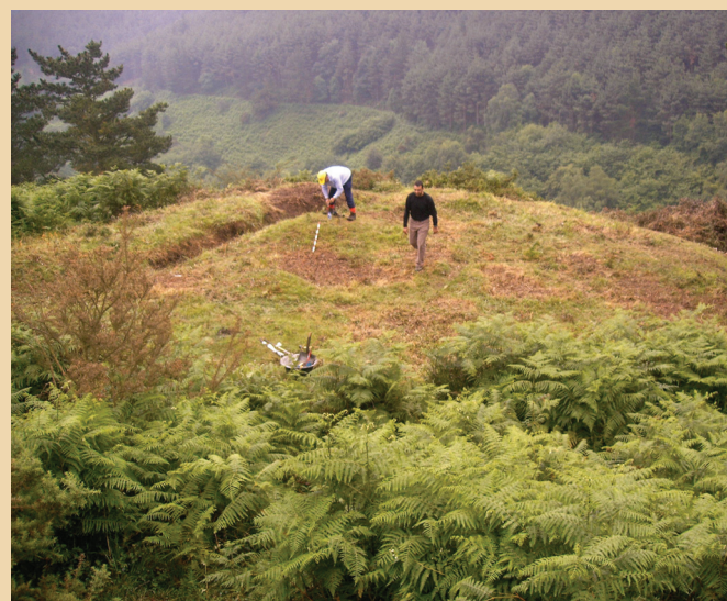
Sondeo arqueológico de la ferrería de monte del Chaparral

acondicionado para efectuar una forja primaria al final del proceso.