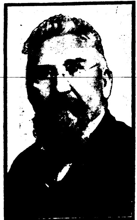
R. J. REYNOLDS Founder and President of the R. J. Reynolds Tobacco Co.

From boyhood days, as a tobacco factory laborer to president and active director of one of the world's largest tobacco industries, tells the story of his life story of Richard J. Reynolds of Winston-Salem, N. C. Mr. Reynolds believes in advertising. He received between two and three per cent of his annual sales in advertising. When you know that in 1914 the R. J. Reynolds Tobacco Company's output amounted to many millions of pounds of tobacco, it isn't difficult to understand just what two or three per cent in advertising means in dollars and cents. The tobacco advertising account is among the largest ever known. In 1904 Mr. Reynolds first realized that properly applied and handled by tobacco worth all he asked for it, advertising was profitable. He invested $100 that year and saw his business grow over 3000 pounds. Next year he spent five times as much—and his business doubled!