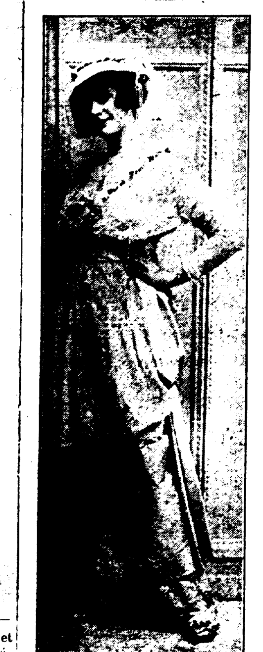
Mlle BILLIE BURKE, dans "Jerry," sera au Tulane, la semaine prochaine.

M. Gustave Ador, président du comité international de la Croix-Rouge, vient de visiter cinq camps de prisonniers allemands du centre de la France. Un rédacteur du "Journal de Genève" est allé recueillir quelques-unes de ses impressions, que voici résumées. C'est à Issoudun que M. Ador s'est rendu tout d'abord. L'industrieuse et pittoresque petite ville de l'Indre abrite en ce moment un millier de pri-