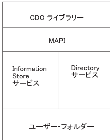
図2. CDO を使用したユーザー・フォルダーへのアクセス

Exchange Server では、図3 に示すように、オブジェクトがツリー構造に編成されます。