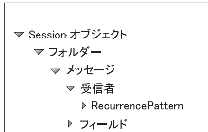
図3. Exchange Server におけるオブジェクト階層

Exchange Server では、図3 に示すように、オブジェクトがツリー構造に編成されます。