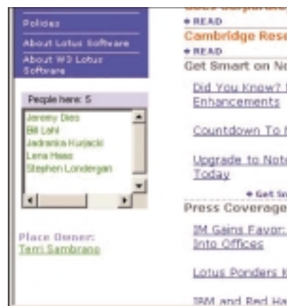
出席顯示 (Presence awareness) 可以內嵌於任何應用程式中。

應用程式共用工作階段讓數百位人員可以檢視同一應用程式或展示白板。多個 Lotus Sametime 伺服器可以連結在一