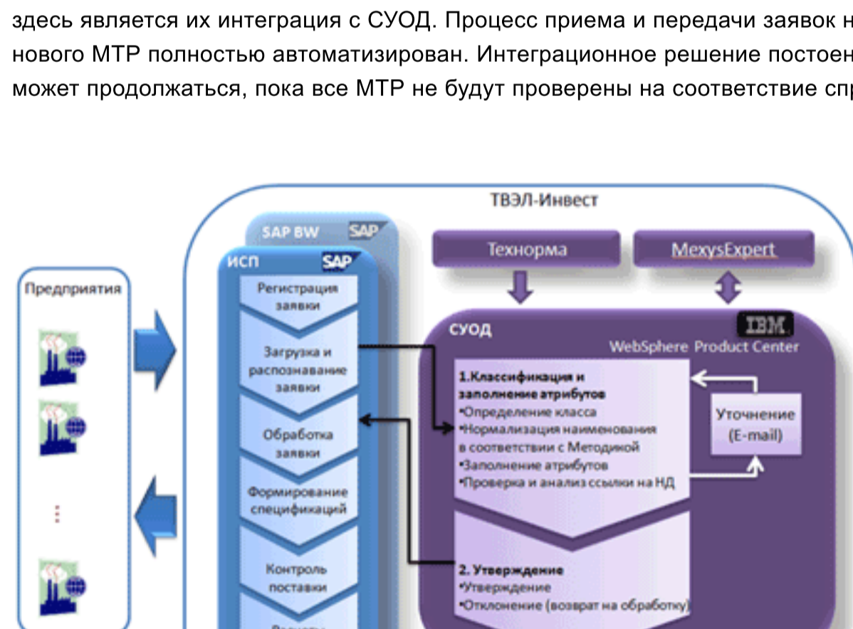
Рис.2. Процесс МТО

В следующем блоке системы, «Управление МТО», осуществляется вся оперативная работа процесса материально-технического обеспечения (МТО). Блок построен на базе модулей SAP, и наиболее важным аспектом здесь является их интеграция с СУОД. Процесс приема и передачи заявок на изменение МТР, а так же на заведение нового МТР полностью автоматизирован. Интеграционное решение постоевно таким образом, что процесс МТО не может продолжаться, пока все МТР не будут проверены на соответствие справочнику МТР в СУОД.