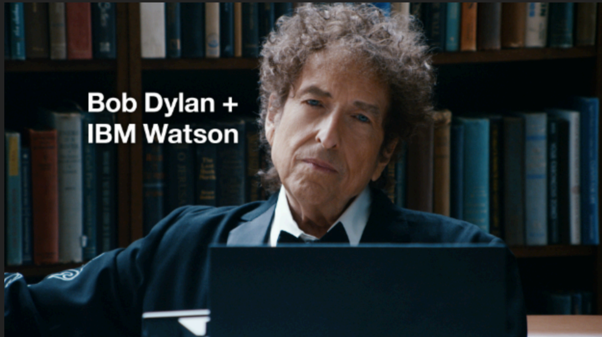
Bob Dylan + IBM Watson