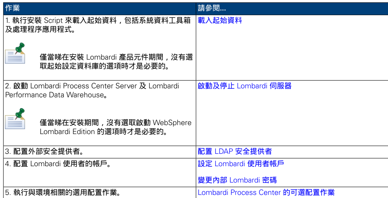
表格 3. 後置安裝配置