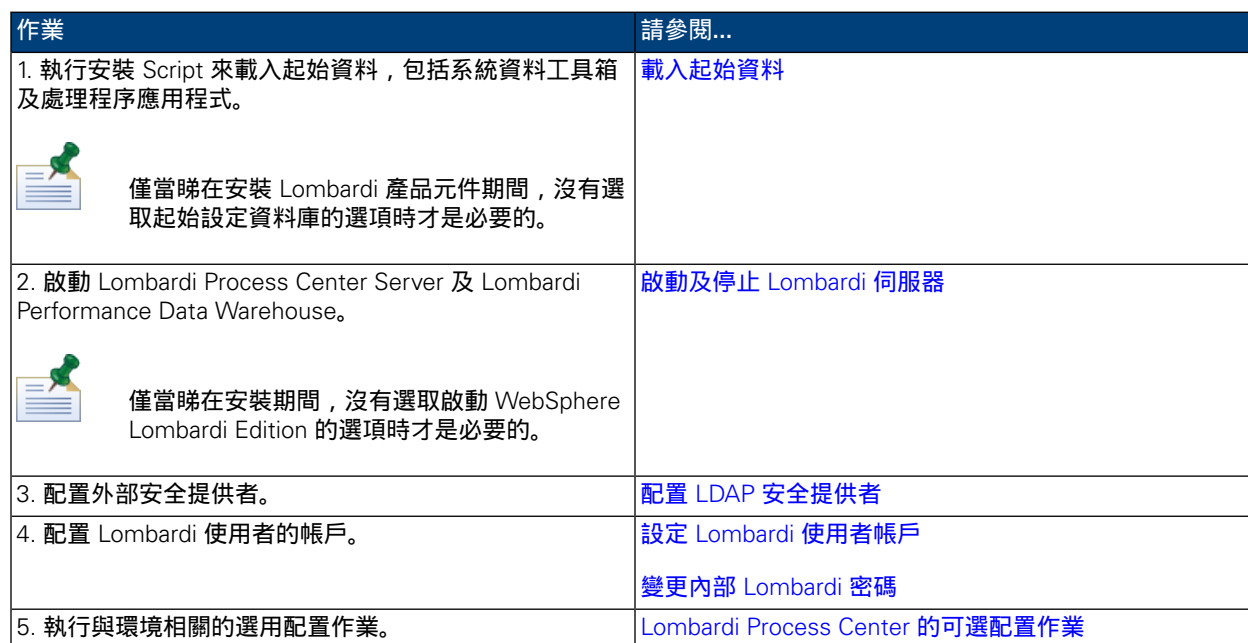
表格 3. 後置安裝配置