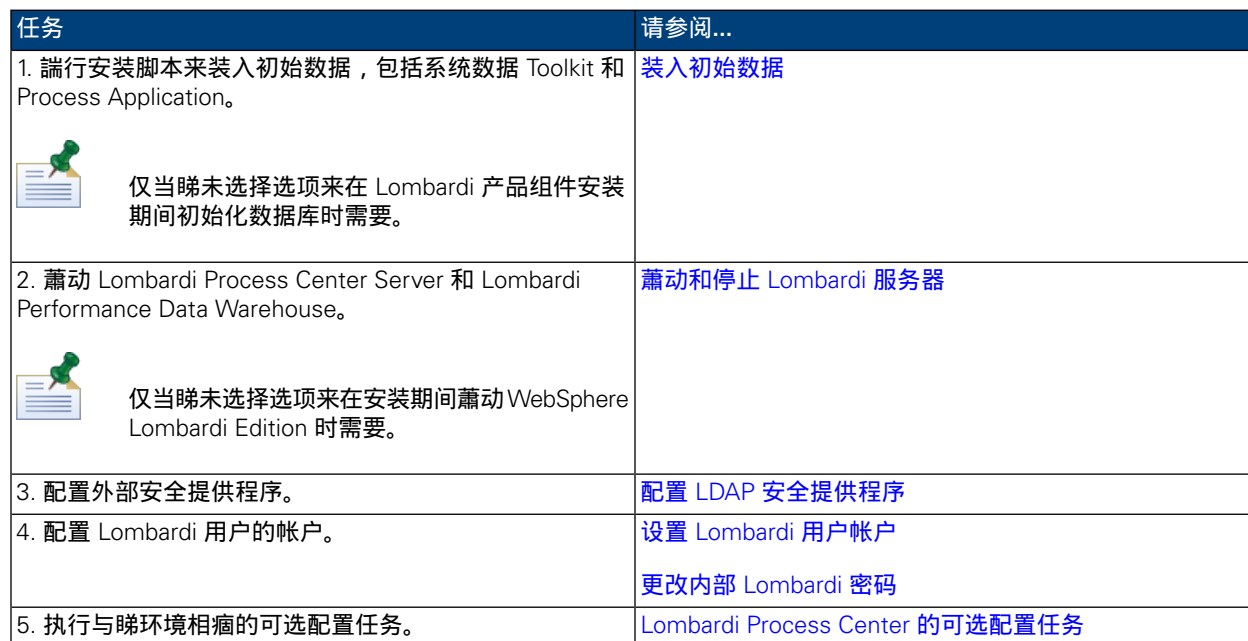
表 3. 安装后配置