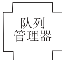
图 1. 独立 MQe 队列管理器

以下图显示一些典型的 MQe 配置。为清楚起见，这些图只显示了已定义的直接连接。您也可定义利用直接连接的间接连接。在这些图中，带箭头并指向服务器的线表示客户机 / 服务器连接。客户机可以使用客户机 / 服务器连接向服务器发送消息，也可以从该服务器拉出发给它们自己的消息。不带箭头的线表明在 MQe 与 MQ 之间启用通信的 MQ 客户机通道。