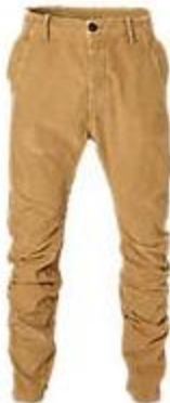
G-Star RAW jeans Bronson Chino 3D Loose Tapered