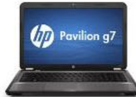
HP Pavilion g7-2054sd laptop