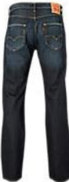
★★★★★ Levi's jeans 501