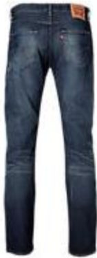
Levi's jeans 501