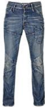
G-Star RAW jeans 5620 3D Tapered