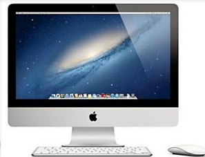
iMac 27 inch (MD095N/A)

De suggesties die we geven zijn gebaseerd op artikelen die je bekeken hebt.