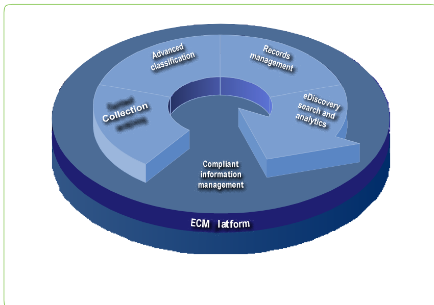
Figura 2: Las funciones de recopilación y archivo de contenidos de Content Collector se integran con funciones de clasificación avanzada, gestión de registros, búsquedas y análisis de eDiscovery en el entorno ECM. También se integran con las soluciones de la infraestructura de información de IBM diseñadas para ofrecer niveles de servicio mejorados, reducir riesgos empresariales y gestionar los volúmenes en constante crecimiento de información empresarial existentes en la actualidad. Esto tiene como resultado procesos optimizados en todo el ciclo de vida de la gestión de la información compatible.

Content Collector se integra con IBM Classification Module, IBM Records Manager, IBM FileNet Records Manager, IBM eDiscovery Manager e IBM eDiscovery Analyzer software. Permite una solución completa que incluye la clasificación avanzada, la gestión de registros, búsquedas y análisis de descubrimiento electrónico (eDiscovery) para todo el ciclo de vida de gestión de la información compatible, y permite gestionar información para que sea de gran seguridad y auditable.