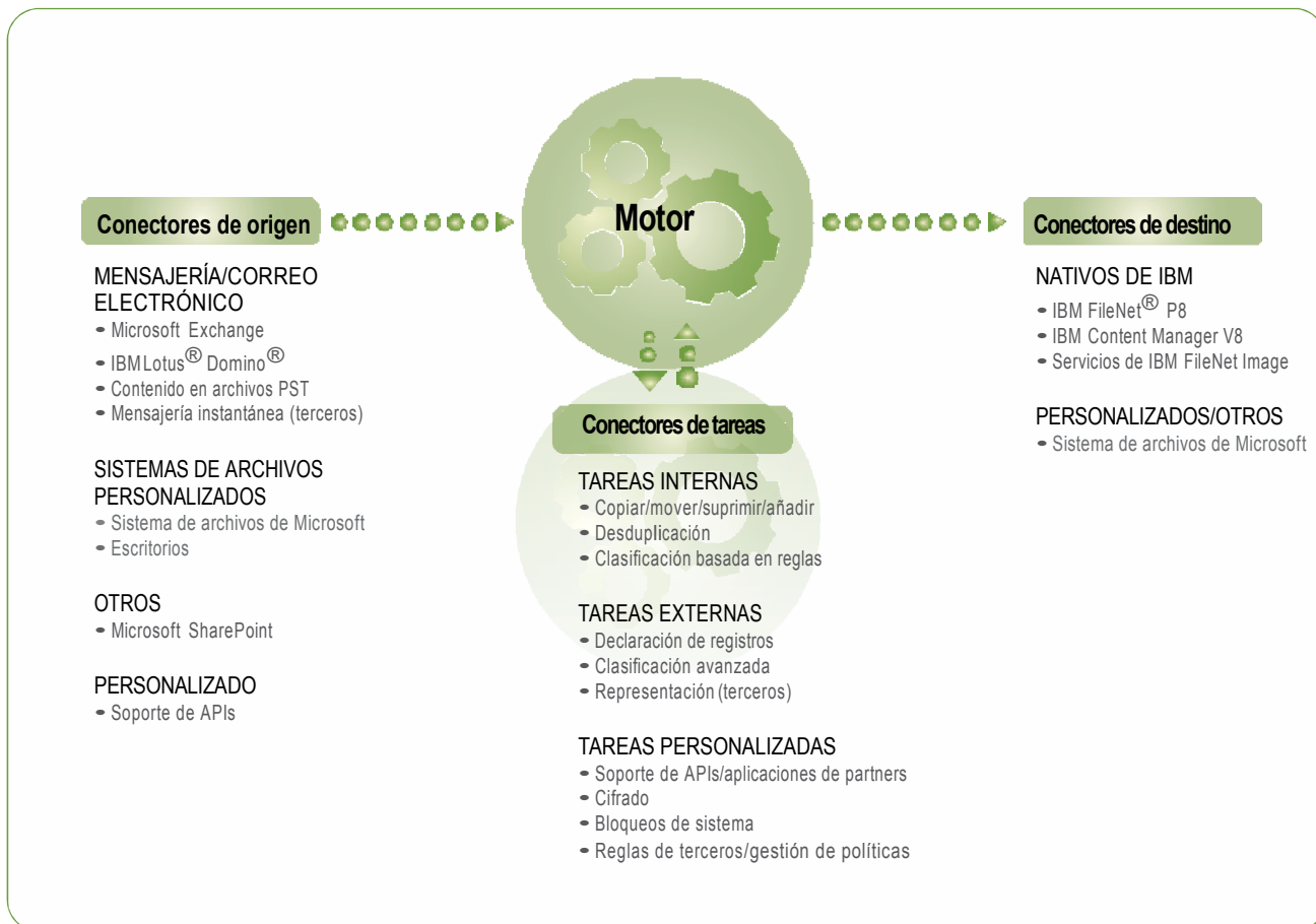
Figura 1: Los productos de recopilación de contenidos y archivo de IBM cuentan con una arquitectura modular y ampliable que proporciona flexibilidad para crecer al tiempo que sus necesidades.