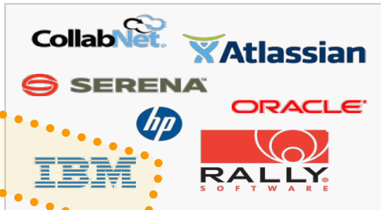
应用程序生命周期管理供应商