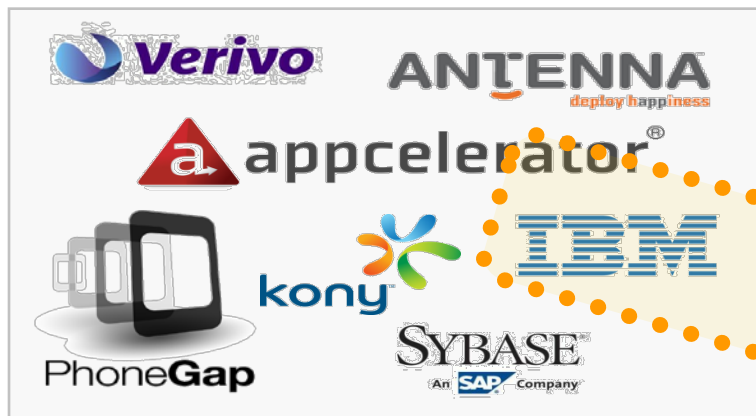
移动应用平台供应商