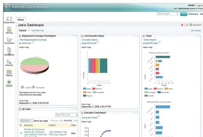
图 2：使用 Rational Quality Manager 软件供开发人员、项目经理和质量专家使用的、基于 Web 的中央测试管理环境，组织们可以利用协作的和可定制的解决方案来进行测试规划、 workflow 控制、跟踪和数据报告。

第一天筹划启用自动和手动测试。此外，以建模所得的项目和迭代计划洞察为基础，A&D 公司可以强制更早地集成子系统和组件，并通过开发存根和模拟代码减少开支。最后，通过更加集成和有效的缺陷跟踪与测试报告，A&D 公司可以帮助改善、提高利益相关人在流程和产品质量方面的信心。