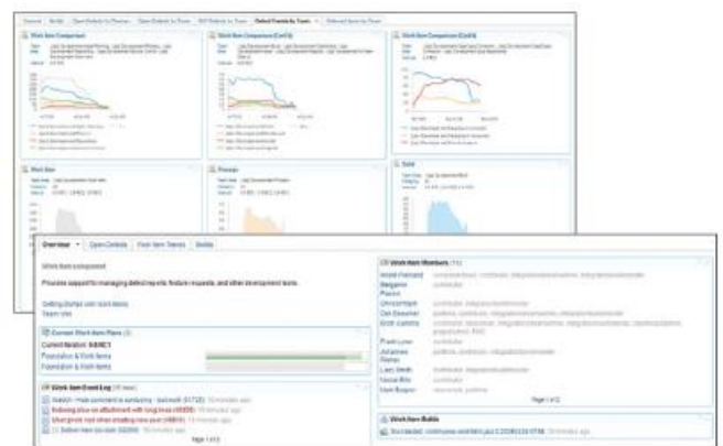
图 3: 使用 Rational Team Concert 平台，A&D 公司可以利用协同开发环境提供规划、更改控制、源代码管理、工作项目管理、构建管理和项目健康功能，以及集成的报告和自动化流程支持。

A&D 团队在地理上的分散和使用多种工具、过程和语言的情况更甚于以往任何时候。随着 A&D 项目复杂性的上升，工程师需要完全集成大量功能，包括需求管理、产品组合管理、系统设计和开发、变更和配置控制，以及软件开发。除了复杂性，A&D 项目规模的不断扩大需要有效的协作，有些 A&D 团队发现这是一个重大的挑战，我们从公布的失败项目中可见一斑。