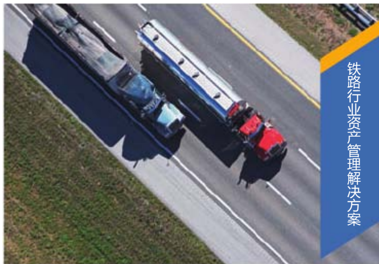
铁路行业资产管理解决方案