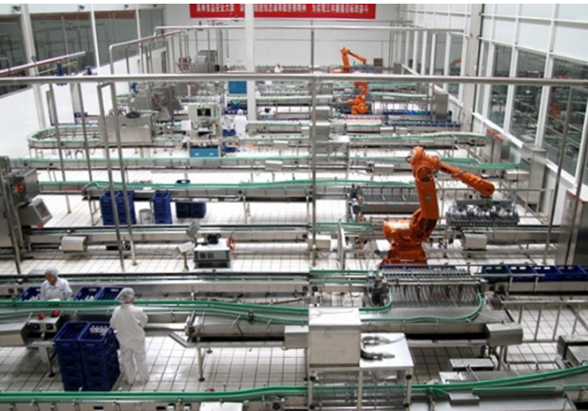
北京三元生产车间

据悉，三元食品在办公自动化系统之外还有多个业务系统，如 ERP、CRM 和电子商务管理系统，而产品生命周期管理系统目前正在选型。徐刚表示，IBM 和三元的合作不仅仅是简单的办公自动化的应用，而将公司现有的各个信息系统通过协同办公平台进行集成、建立统一的管控平台，在企业整体信息化战略中也发挥着举足轻重的地位。”