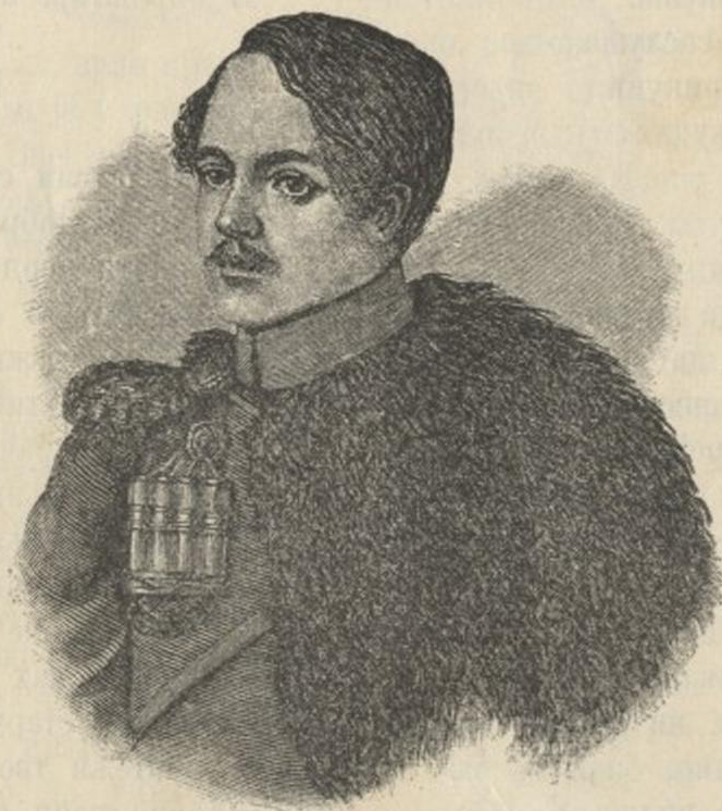
М. Ј. Љермонтов, руски пјесник.

И жељк'о мили завичај. Ал' ропству и он привикне И туђи језик обикне; Свети га отац покрсти И он у цвету младости, Не знајућ светске сладости, Обући хтеде црнине И у монаштву тражит' врлине.