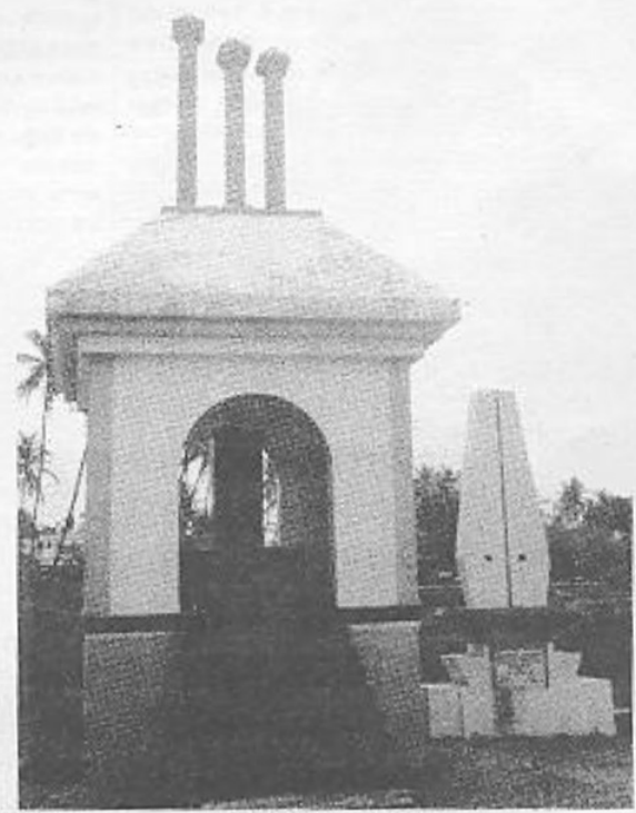
കണ്ണൂർ പയ്യാമ്പലത്തെ സ്വദേശാഭിമാനി സ്മാരകം