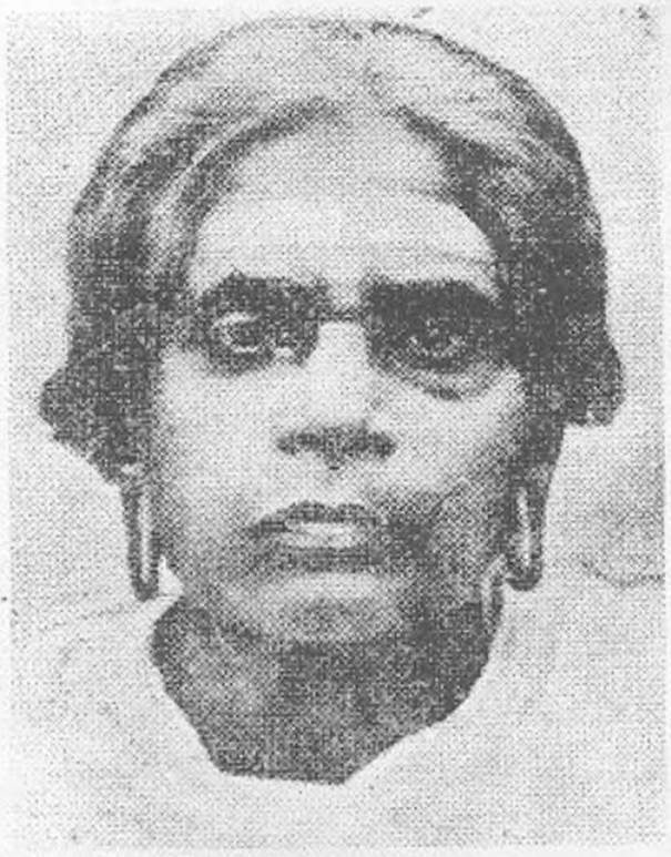
സ്വദേശാഭിമാനിയുടെ ഭാര്യ മാതാവായ തരവത്ത് അമ്മാളു അമ്മ