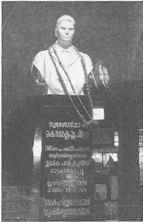
തിരുവനന്തപുരത്ത് നെയ്യാറ്റിൻകരയിലെ സ്വദേശാഭിമാനി പ്രതിമ