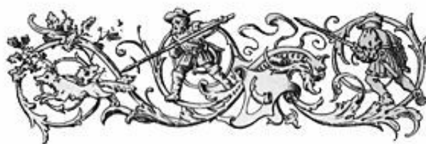
Table des Eaux-Fortes