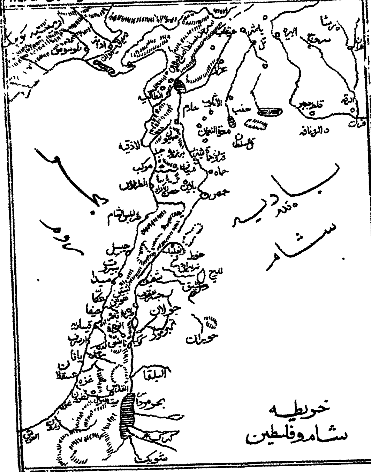
شام و فلسطین خوطیہ

کتابوں کے جن میں ترجمہ ابن خلکان موجود ہے ص ۳۹۷ پر دئے گئے ہیں (وفیات الاعیان (طبع ۱۳۱۷ھ) ج ۲ ص ۲۲۱ ترجمہ وفیات ارسطو جلد ۱ ص ۱۹ (حیات ابن خلکان)؛