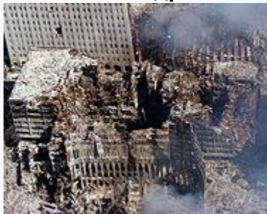
1өдрийн дараа дэлхийн худалдааны төв 6,7,1- ийн үлдсэн байдал

Энэ дайралтын улмаас нийтдээ 299 хүн үхсэн ба үүний дотор 19 алан хядагчид 2977 хохирогч байжээ. Энд 246 хүн нь онгоцонд зорчиж явсан хүмүүс 2606 хүн нь Newyork хотын хүмүүс, 125 нь Пентагоны иргэд байжээ. Нас барагсдын ихэнх хувь нь жирийн иргэд; Пентагонд алагдсан хүмүүсийн 55 нь цэргийн албан хаагч байжээ.