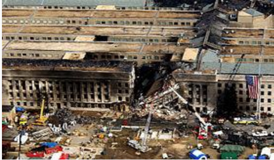
Пентагонд болсон сүйрэлийн улмаас үүссэн нуранги

Ихэр цамхаг, олон тооны Худалдааны төвийн барилга болон Nicholas Greek Orthodox-ын сүм сүйтгэгдсэн. Хойд, Өмнөд цамхаг, Marriott зочид буудал (ДХТ3) болон ДХТ7 үндсэндээ сүйрсэн. Дэлхийн худалдааны төвийн 4,5,6-р барилгууд ч явган хүний замаар холбогдсон байдаг учир нэлээд хохирол амссан. 130-р эрх чөлөөний гудамжинд байрлах Deutsche банкны барилга сүйрэлд өртөж дараа нь нурсан. Дэлхийн санхүүгийн төвийн 2 барилга нэлээд хохирол амссан. Дэлхийн худалдааны төвөөс Liberty гудамжны Deutsche банкны барилга хүртэлх хэсэгт ямар ч хүнгүй болсон учир нь тэр газарт маш хортой нөхцөл байдал үүссэн байсан. Manhattan-ы харилцааны коллеж сүйрэлийн үеэр их хэмжээний хохирол амсч дахин баригдсан. Хөрш зэргэлдээ барилгууд халдлагад нэлээд өртсөн ба түүний дотор 90-р өргөн чөлөөний Verizon барилга өртсөн хэдий ч дахин сэргээн засварлагдсан. Дэлхийн санхүүгийн төвийн барилга, One liberty plaza, 90-р гудамжны сүм нэлээд халдлагад өртсөн хэдий ч дахин сэргээн засварлагдсан.