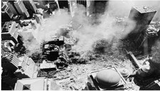
2001оны 9-р сарын 17ны агаараас авсан зураг