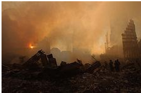
2001.9.13ны өдрийн Шатсан барилга байгууламжны дүр зураг