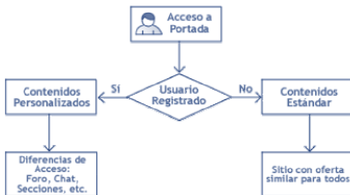
[D] Figura 5: Ejemplo de Diagrama de Interacción.

Por ejemplo, el siguiente diagrama muestra las posibilidades de reacción que tiene un Sitio Web ante el ingreso de un usuario registrado en un sitio: