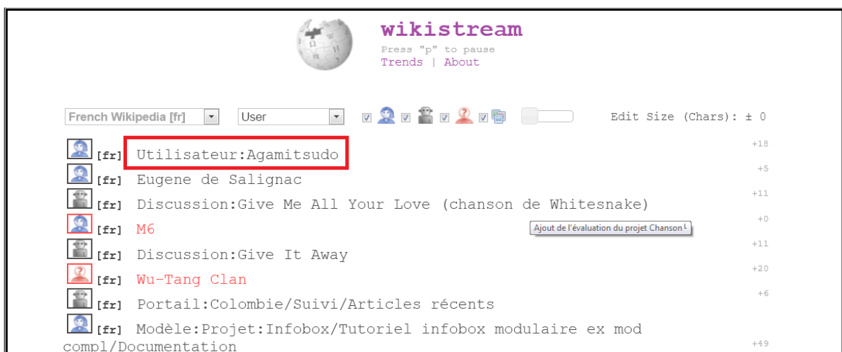
Figure 2 : Modification de la page Utilisateur:Agamitsudo, vue sur Wikistream .