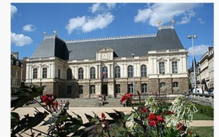
Le palais du parlement de Bretagne, reconstruit après l'incendie de 1994. Il abrite la Cour d'appel de Rennes.