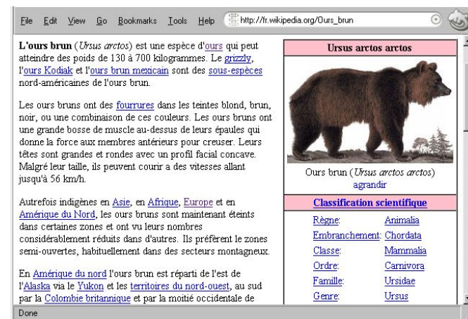
Capture d'écran d'un article sur l'ours brun

Venez participer a la grande aventure Wikipédia