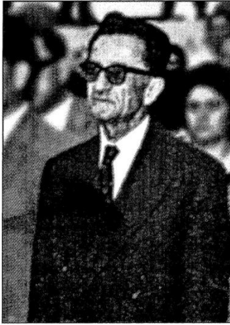
Ο Γιάννης Σκυλοδήμος γιος του Δημάρχου Θυάμου Μάρκου Σκυλοδήμου, πέθανε υπεραιωνόβιος το 2001 στην Αμφιλοχία.