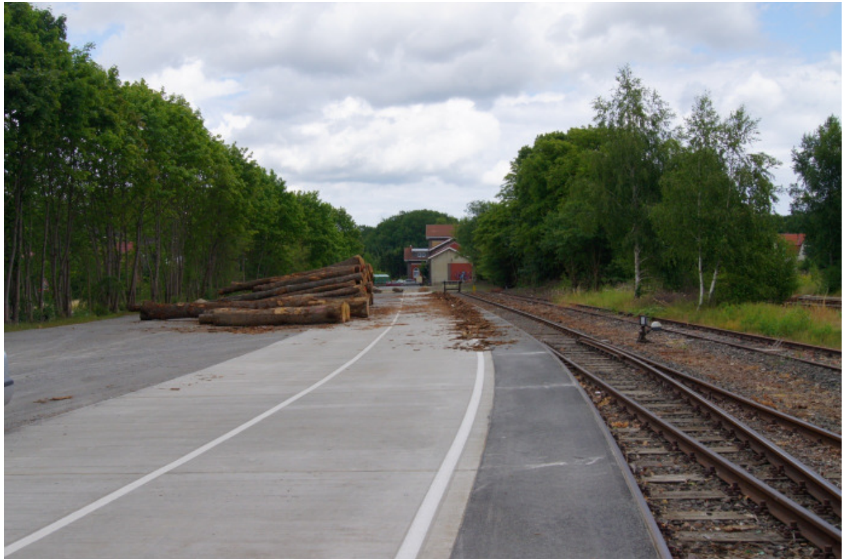
Abbildung 3: Ladestraße Gleis 13 w (Westliches Ende mit dem Lagerplatz von Waldkonsulting)