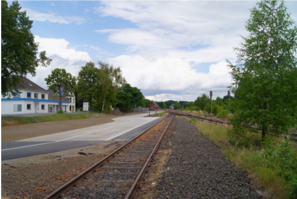
Abbildung 1: Ladestraße an Gleis 13 o (Östliches Ende des Bahnhofs) mit der Lagerfläche Waldkonsulting.