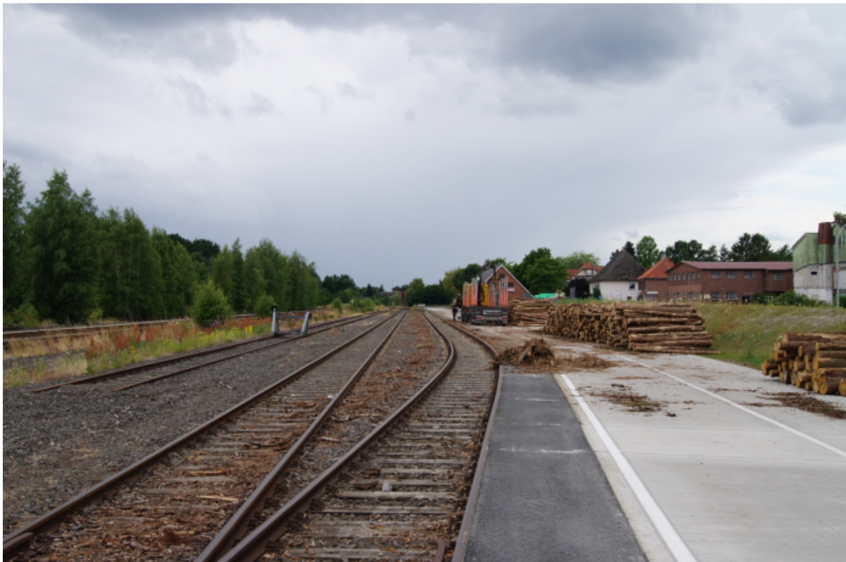
Abbildung 2: Ladestraße am Gleis 14 w