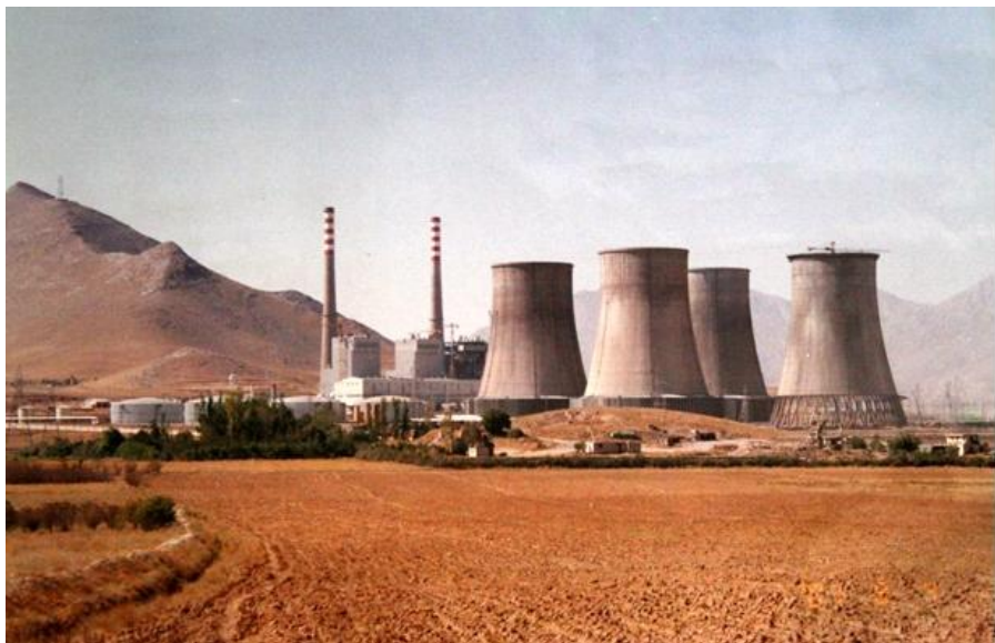
东方电气集团在伊承建的4×32.5万千瓦电厂

【概况】中、伊经贸关系始于1950年。1971年8月两国建交以后，双边经贸关系有了进一步的发展，但在我国改革开放前，双边贸易发展相对缓慢。1978年以前，两国进出口贸易总额最高纪录仅约8000万美元。1979年后，中伊双边贸易额开始稳步上升。