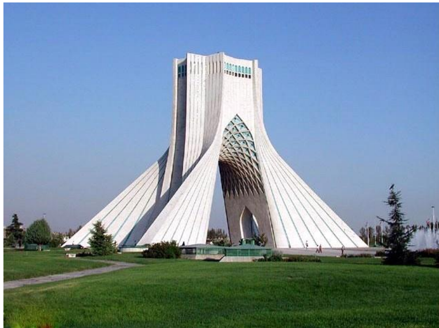
伊朗德黑兰自由塔

伊朗矿产资源非常丰富，其中石油储量约190亿吨，居世界第二位，占世界总储量的12%；天然气储量31万亿立方米，居世界第二位，占世界总储量的18%；铜矿储量30亿吨，居世界第三位，矿石平均品位0.8%。其他矿产资源有：锌矿（储量5000万吨，居世界第十位）、铬矿（储量1500万吨）、煤炭（储量35亿吨）、铁矿（储量47亿吨），此外还有金、铝、铀、锰、锑、铅、硼和重晶石等资源。