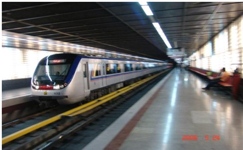
行驶在中信公司承建的德黑兰地铁一号线上的中国产新型地铁客车