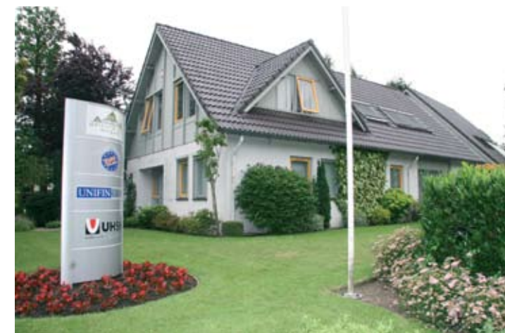
Het hoofdkantoor van Euro Holding / Unifin Groep in Velp

De drie maanden durende ontdekkingstocht van vier jaar geleden heeft zijn vruchten afgeworpen. Turkije is goed voor het bedrijf geweest en deze wil op haar beurt goed zijn voor de mensen in Turkije. Euro Holding /Unifin Groep sponsort jaarlijks studenten met hun studiekosten. Stuk voor stuk begaafde kinderen die puur door