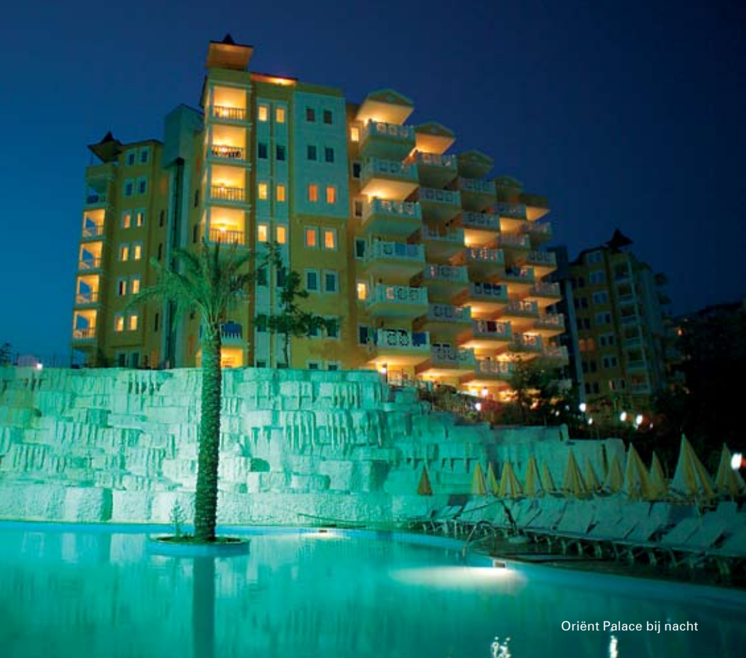
Oriënt Palace bij nacht

'Ik had helemaal niets met Turkije, tot ik er een keer was geweest! De mensen zijn er zo vriendelijk en gastvrij'