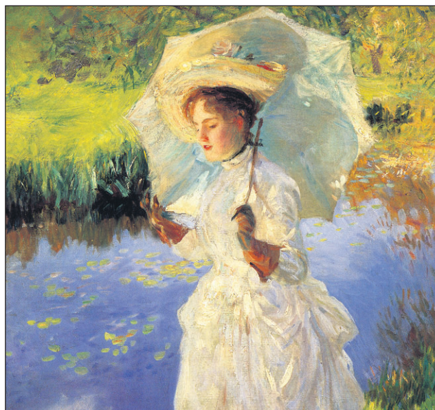
Morning Walk, John Singer Sargent, 1888. Colección privada. 421

Terra Foundation, copatrocinadora la exposición con Art Museum. (Pág. 7)