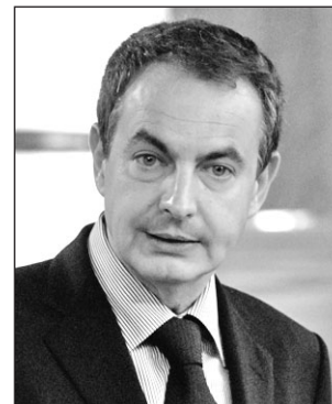
José Luis Rodríguez Zapatero

El nuevo anteproyecto de ley pretende dar reconocimiento a este Tercer Sector, dándole una cobertura jurídica. Por un lado define las entidades que se enmarcan dentro de la economía social, re-