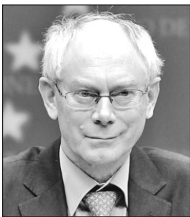
Herman van Rompuy

El presidente del Consejo Europeo, Van Rompuy, comprometió su respaldo al Estatuto Único de Fundaciones en el transcurso de su intervención en Bruselas ante mil representantes del sector. (Pág. 10)