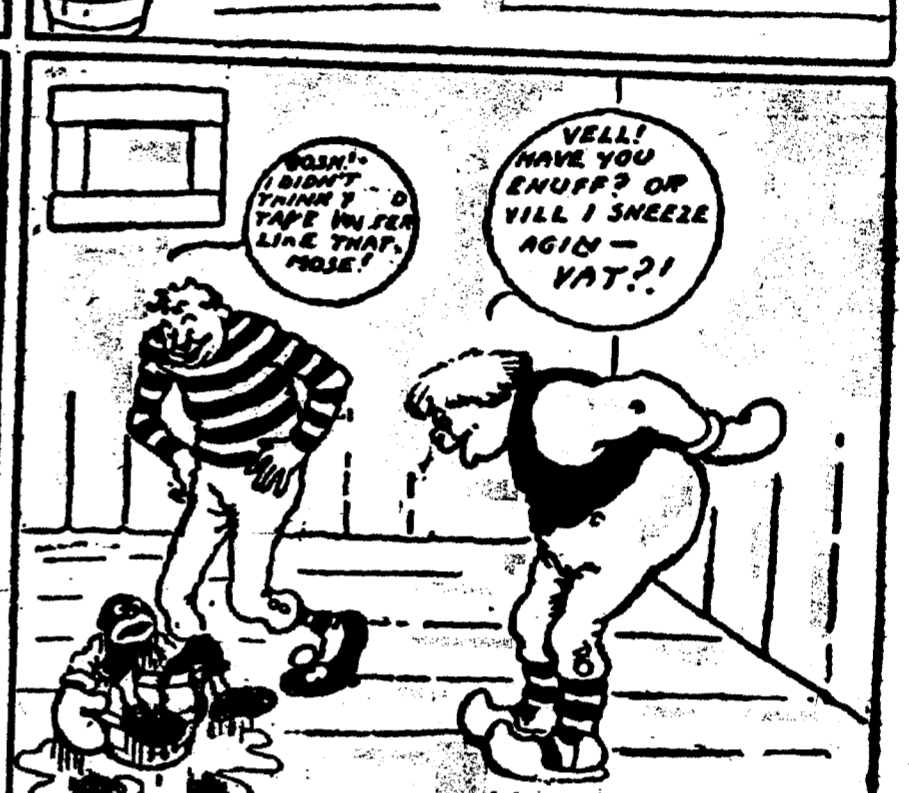
No. 1. Simon. — "Paf — sur le nez du professeur." Mose. — "Beh, — j'peux en faire autant." No. 2. Simon. — "Vas - y Mose, et observe les règlements." Mose. — "Maintenant, hardi M. le professeur." No. 3. Simon. — "Bravo, c'est bien tapé." Mose. — "Paf, sur le nez du professeur." No. 4. Simon. — "Allons, hardi, professeur. Mose Cestonaque." Mose. — "Ha, ha! Attends que j'le finisse." No. 5. (Le professeur éternue. Mose tombe à la renverse.) No. 6. Simon. — "Sapristi, Mose, j'te croyais plus solide que ça." Le professeur. — "Eh bien. Veux-tu que j'éternue une seconde fois?"