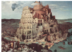
La Tour de Babel , Bruegel L'Ancien/Domaine public