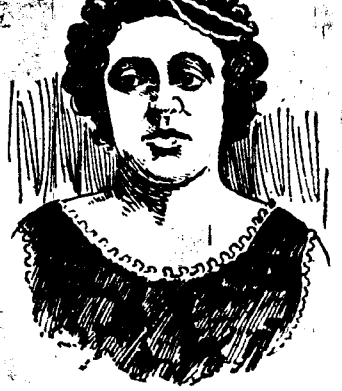
MORT D'UN GRAND ITALIEN.